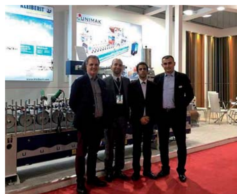
Компания «Унимак» на выставке «Dowintech» в Тегеране

Приглашаем посетить наш стенд на выставке LIGNA 2017 (зал 17, В20), которая будет проводиться в г. Ганновере (Германия) с 22 по 26 мая 2017 г. На нашем стенде вы сможете получить более подробную консультацию и ознакомиться с функциями оборудования.